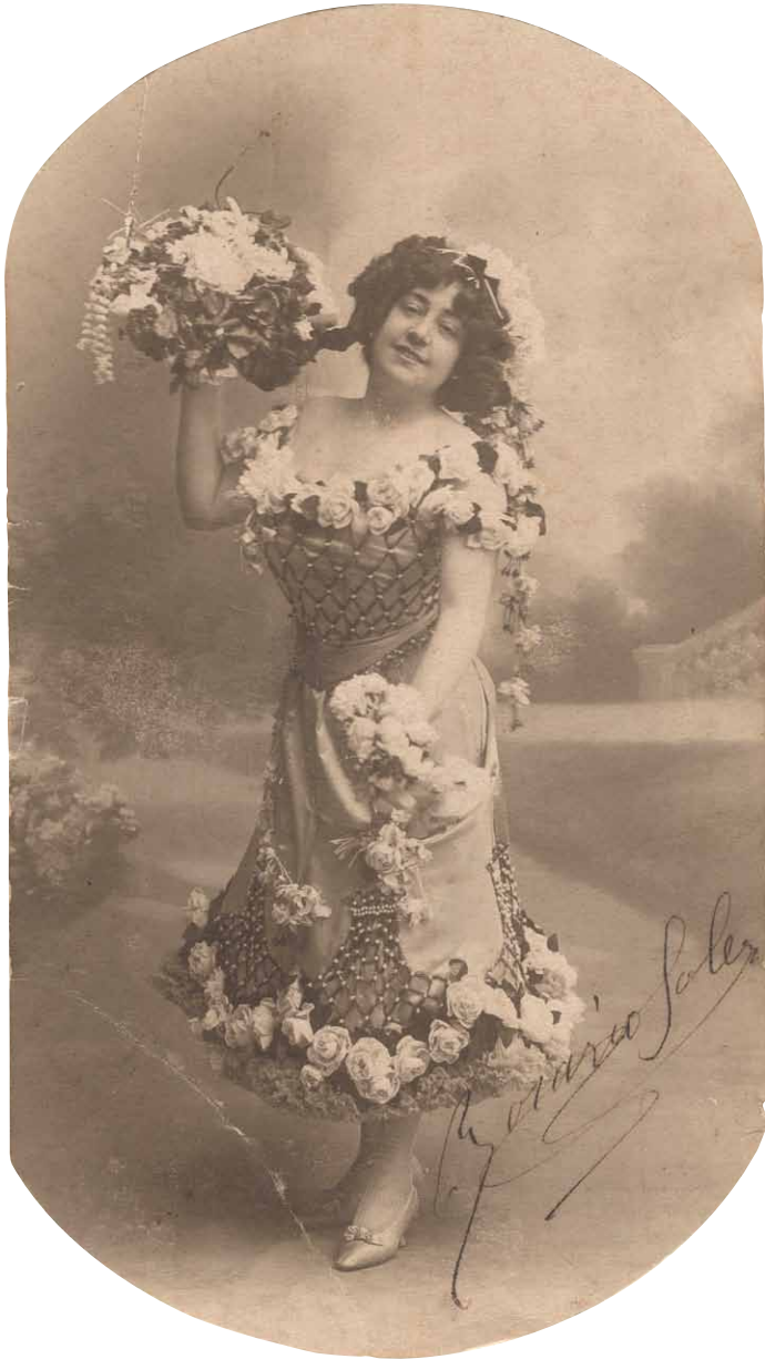
El poeta de la vida en el célebre pregón de las flores.